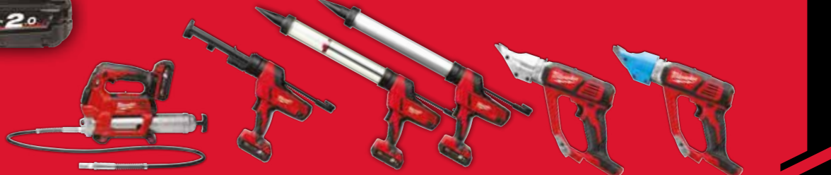
M18 GG-201C M18 SMÖRJSPRUTA 4933440490 C18 PCG/310C-201B M18 310 ML FOG- OCH LIMPISTOL 4933441310 C18 PCG600-201B M18 600 ML FOG- OCH LIMPISTOL TRANS: 4933441808 ALU: 4933441305 M18 BMS12-0 M18 PLÅTSAX 4933447925 M18 BMS20-0 M18 PLÅTSAX 4933447935