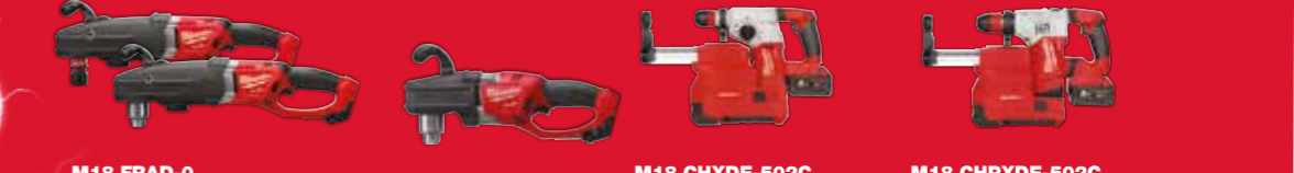
M18 FRAD-0 M18 FUEL SUPER HAWG® VINKELBORRMASKIN QUIK-LOK™ CHUCK: 4933451290 KEYS CHUCK: 4933451289 M18 CRAD-0 M18 FUEL VINKELBORRMASKIN 4933447730 M18 CHXDE-502C M18 FUEL SDS-PLUS KOMBIHAMMARE MED DAMMUTSUG 4933448185 M18 CHPXDE-502C M18 FUEL SDS-PLUS KOMBIHAMMARE MED DAMMUTSUG 4933448180