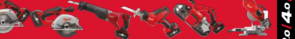
HD18 JSB-402C M18 STICKSÄG 4933426660 HD18 CS-402B M18 CIRKELSÄG 4933441400 HD18 MS-402B M18 METALLSÄG 4933441390 M18 BSX-402C M18 SAWZALL™ TIGERSÄG 4933447285 C18 HZ-402B M18 HACKZALL™ TIGERSÄG 4933441340 HD18 BS-402C M18 BANDSÄG 4933441415 M18 SMS216-0 M18 216 MM KAP-/GERSÄG 4933446780