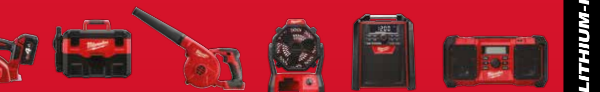
M18 VC-0 M18 7.5L VÅT/TORR DAMMUGARE 4933433601 M18 BBL-0 M18 BLÅSARE 4933446216 M18 AF-0 M18 FLÅKT 4933451022 M18 RC-0 M18 RADIO MED LADDARE 4933446639 M18 JSR-0 M18 RADIO 4933451250

RED LITHIUM-ION™ 2.0 / 4.0 / 5.0 / 9.0 Ah