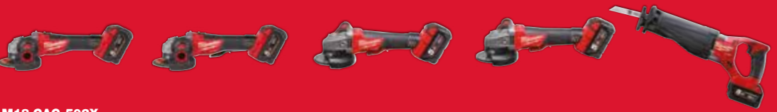
M18 CAG-502X M18 FUEL 115-125 MM VINKELSLIP 0 115: 4933448861 0 125: 4933448866 M18 CAG125XPD-502X M18 FUEL 125 MM VINKELSLIP 4933448864 M18 CAG115XPDB-502X M18 FUEL 125 MM VINKELSLIP 4933451543 M18 CAG125XPDB-502X M18 FUEL 125 MM VINKELSLIP 4933451544 M18 CSX-502X M18 FUEL SAWZALL™ TIGERSÄG 4933451378