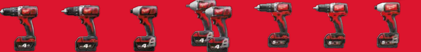
M18 BPD-402C M18 SLAGBORRMASKIN 4933443520 M18 BDD-402C M18 BORR-/SKRUVDRAGARE 4933443565 M18 BID-402C M18 SLAGSKRUVDRAGARE 4933443580 M18 BIW-402C M18 MUTTERDRAGARE 1/2": 4933443607 3/8": 4933443600 M18 BLPD-502C M18 KOLBORSTFRI SLAGBORRMASKIN 4933448472 M18 BLDD-502C M18 KOLBORSTFRI BORR-/SKRUVDRAGARE 4933448458 M18 BLID-502C M18 KOLBORSTFRI SLAGSKRUVDRAGARE 4933448457