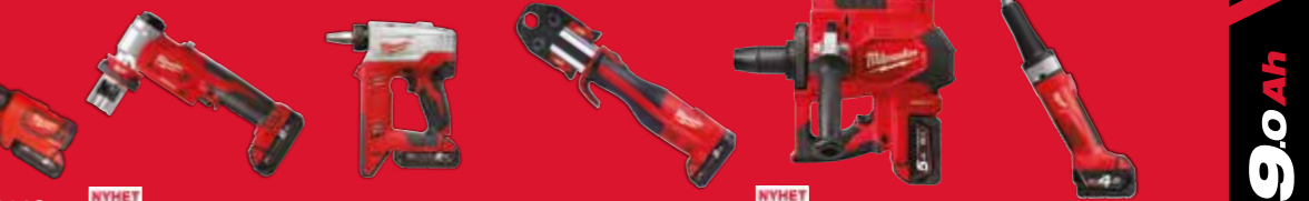
M18 HCC-201C NYHET ACSR-SET M18 FORCELOGIC™ HYDRAULISKT KABELSAX 4933451196 M18 HCC-201C NYHET CU/AL-SET M18 FORCELOGIC™ HYDRAULISKT KABELSAX 4933451199 M18 HKP-201CA NYHET M18 FORCELOGIC™ HYDRAULISKT HÅLSTANS 4933451204 HD18 PXP-H06202C M18 EXPANSIONSVERKTYG 4933441771 M18 BLHPT-202C M18 KOLBORSTFRITT PRESSVERKTYG 4933451132 M18 BLPXPL-502C M18 FORCELOGIC™ HYDRAULISKT EXPANSIONSVERKTYG 4933451353 HD18 SG-401C M18 RÅK SLIPMASKIN 4933426665