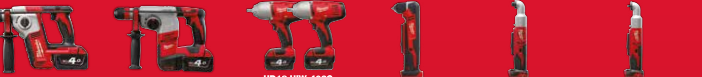
M18 BH-402C M18 SDS-PLUS KOMBIHAMMARE 4933443330 HD18 HX-402C M18 SDS-PLUS KOMBIHAMMARE 4933441280 HD18 HIW-402C M18 MUTTERDRAGARE MED LÄSPIN 4933441260 FRIKTIONSRING: 4933441789 C18 RAD-0 M18 VINKELSKRUVDRAGARE 4933427189 M18 BRAID-0 M18 VINKELSKRUVDRAGARE 4933447891 M18 BRAIW-0 M18 VINKELMUTTERDRAGARE 4933447899