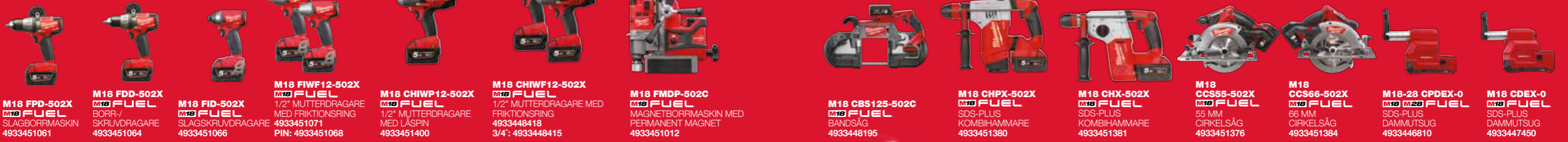
M18 FPD-502X M18 FUEL SLAGBORRMASKIN 4933451061 M18 FDD-502X M18 FUEL BORR-/SKRUVDRAGARE 4933451064 M18 FID-502X M18 FUEL SLAGSKRUVDRAGARE 4933451066 M18 FIWF12-502X M18 FUEL 1/2" MUTTERDRAGARE MED FRIKTIONSRING 4933451071 PIN: 4933451068 M18 CHIWP12-502X M18 FUEL 1/2" MUTTERDRAGARE MED LÄSPIN 4933451400 M18 CHIWF12-502X M18 FUEL 3/4" MUTTERDRAGARE MED FRIKTIONSRING 4933448418 3/4": 4933448415 M18 FMDP-502C M18 FUEL MAGNETBORRMASKIN MED PERMANENT MAGNET 4933451012 M18 CBS125-502C M18 FUEL BANDSÄG 4933448195 M18 CHPX-502X M18 FUEL SDS-PLUS KOMBIHAMMARE 4933451380 M18 CHX-502X M18 FUEL SDS-PLUS KOMBIHAMMARE 4933451381 M18 CCS55-502X M18 FUEL 55 MM CIRKELSÄG 4933451376 M18 CCS66-502X M18 FUEL 66 MM CIRKELSÄG 4933451384 M18-28 CPDEX-0 M18 FUEL SDS-PLUS DAMMUTSUG 4933446810 M18 CDEX-0 M18 FUEL SDS-PLUS DAMMUTSUG 4933447450