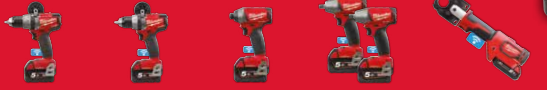
M18 ONEPD-502X ONE KEY M18 FUEL SLAGBORRMASKIN 4933451147 M18 ONEDD-502X ONE KEY M18 FUEL BORR-/SKRUVDRAGARE 4933451149 M18 ONEID-502X ONE KEY M18 FUEL SLAGSKRUVDRAGARE 4933451370 M18 ONEIW-502X ONE KEY M18 FUEL 1/2" MUTTERDRAGARE FRIKTIONSRING: 4933451374 PIN: 4933451372 M18 HCCT-201C ONE KEY M18 FUEL HYDRAULISKT PRESSVERKTYG 4933451194