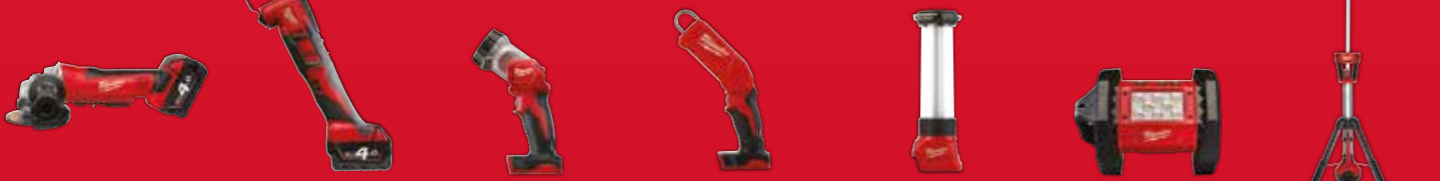
HD18 AG-402C M18 115-125 MM VINKELSLIP 0 115: 4933441300 0 125: 4933441507 M18 BMT-421C M18 MULTIVERKTYG 4933446210 M18 TLED-0 M18 TRUEVIEW™ LAMPA 4932430361 M18 IL-0 M18 TRUEVIEW™ INSPEKTIONSLAMPA 4932430564 M18 LL-0 M18 TRUEVIEW™ LANTERN 4932430563 M18 AL-0 M18 TRUEVIEW™ OMRÅDESBELYSNING 4932430392 M18 SAL-0 M18 TRUEVIEW™ LAMPA MED STATIV 4933451246